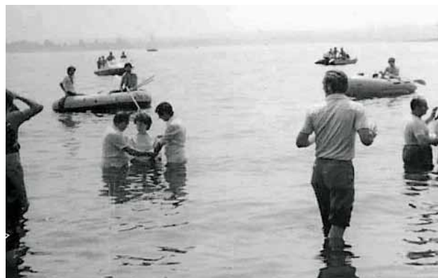
Battesimi al Lago Maggiore negli anni '70

L'opera evangelica ad Arona partì in modo spontaneo il 10 maggio 1964, quando due giovani