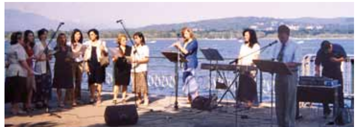
a destra dall'alto: tenda evangelistica nel 1972, battesimi nel 1986, il coro negli anni '90, evangelizzazione sulle rive del lago

Nel corso degli anni, la popolazione della chiesa di Arona è cresciuta e cambiata. Nonostante le difficoltà e le sfide sempre nuove, non possiamo che riconoscere la fedeltà del nostro Dio, che desidera una testimonianza efficace da parte del Suo popolo.