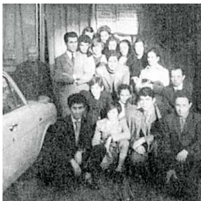
il locale di Via Mazzini

Raccontare la storia di sessant'anni di una chiesa locale significa narrare le vicende di un organismo vivente, seppur spirituale, che nasce, cresce, si sviluppa, affronta sfide, intraprende iniziative, prende decisioni, con lo scopo di rendere testimonianza della salvezza ricevuta per grazia e annunciare il lieto messaggio di Gesù a quanti, nei luoghi vicini, ancora non hanno gustato l'amore di Dio.