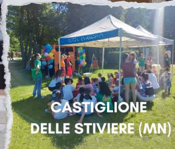
CASTIGLIONE DELLE STIVIERE (MN)

BOLZANO (BZ). Le chiese della zona, in collaborazione con la chiesa di Padova, hanno organizzato a scopo evangelistico un seminario dal titolo “Dalle leggi della chimica a quelle dello Spirito” che si è tenuto presso la sala polifunzionale Premstaller situata nella zona a nord della città di Ötzi (la più famosa mummia del Similaun).