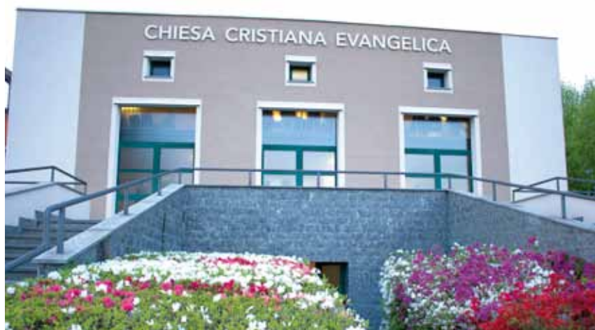
Arona (NO) oggi, in Via Vittorio Veneto