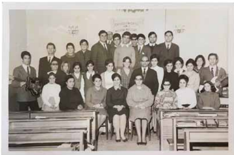
gruppo di credenti nel locale di culto di Crotona, anni '70