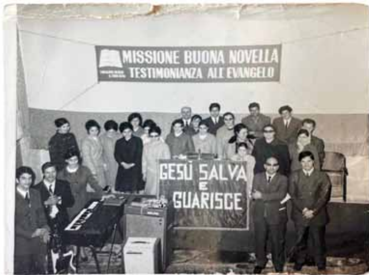
tenda di evangelizzazione nel paese di Lago nel periodo 1968-70

numerosissime occasioni in Convegni, incontri giovanili, incontri regionali, nazionali e internazionali. Nel corso di itinerari ministeriali più volte si è recato negli Stati Uniti e ben cinque volte in Australia. Le sue predicazioni, impresse in maniera indelebile nel cuore degli uditori, sono state semplici, efficaci, spontanee, mai improvvisate, denotando una profonda preparazione ai piedi del Maestro.